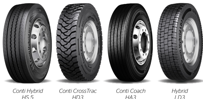
Conti Hybrid HS 5